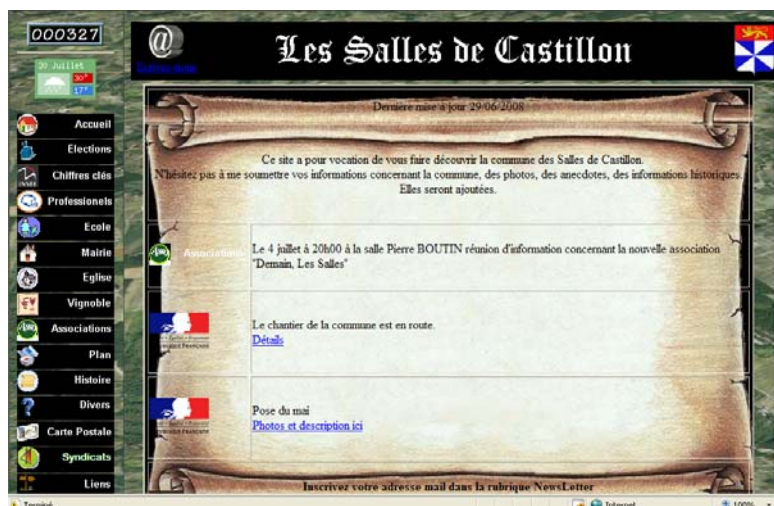
Site internet des Salles de Castillon : http://lessallesdecastillon.free.fr

De plus lui est associé une lettre d'information électronique qui vous donne les informations ponctuelles au fil de l'eau.